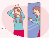
Baisse de l'estime de soi